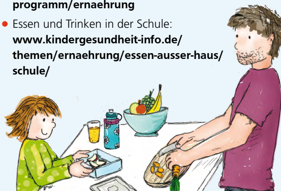
Illustration: Lisa Boy

Alle interessierten Grundschulen und Förderschulen im Rheinland und Hamburg sind eingeladen, an dem Programm Gesund macht Schule teilzunehmen. Die Schulen erhalten ein Unterstützungskonzept und Materialien zur Umsetzung der folgenden Gesundheitsthemen: